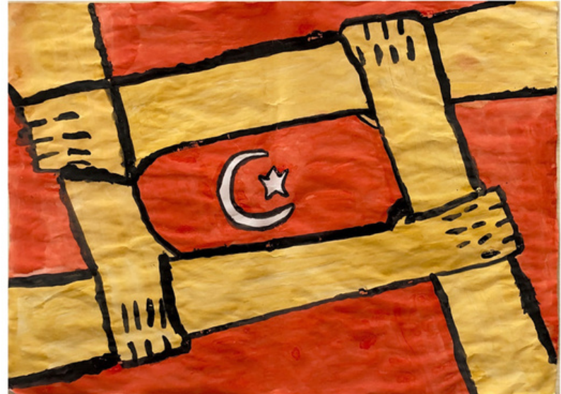
Nisanur ÇETİN 6/C 369