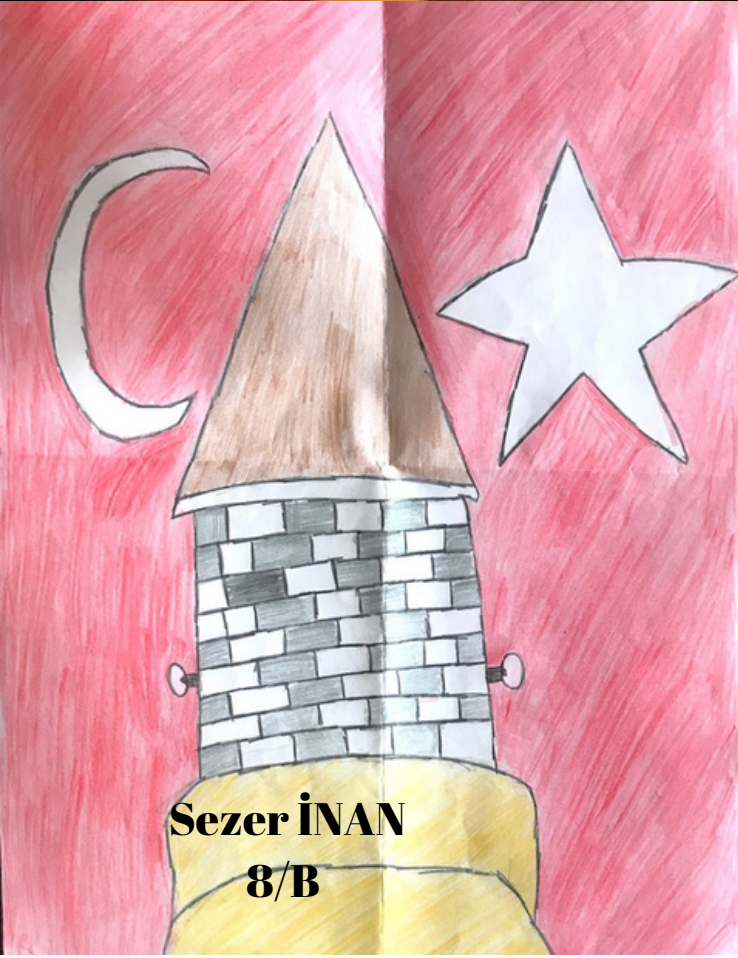
Sezer İNAN 8/B